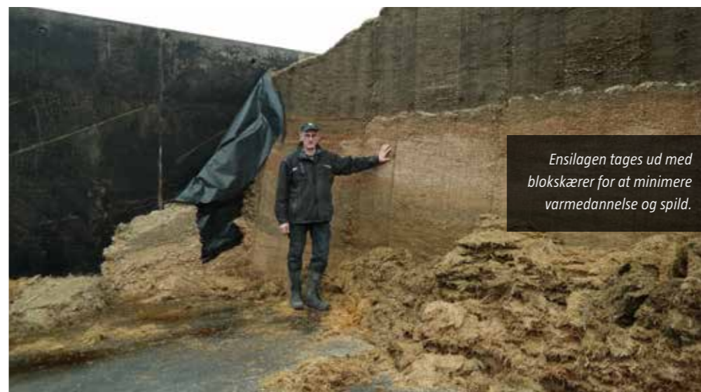
Ensilagen tages ud med blokskærer for at minimere varmedannelse og spild.

Anlægget vasker 12 tons sand ud i døgnet med en effektivitet på 98-99 pct.